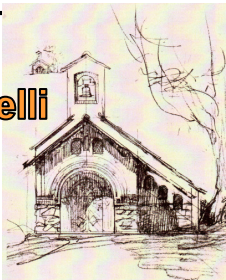
Chiesa ai Piani dei Resinelli Cento anni di storia

a cura della Parrocchia di San Lorenzo in Abbazia Sopr'Adda