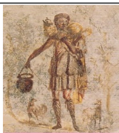
CUSTODISCI IL CUORE

E' edito dalla Libreria Editrice Vaticana.